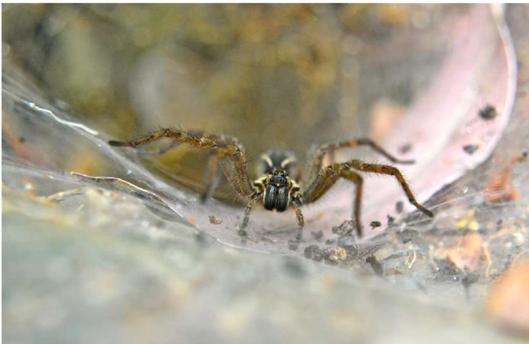
Aglaoctenus lagotis

Después que finalice la sesión, solicitaremos que retiren sus posters porque tendremos nuevas presentaciones de posters al día siguiente.