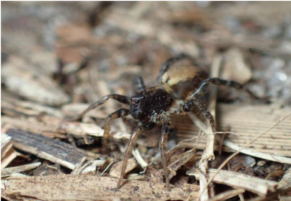
Abaycosa nanica

El evento cuenta con el apoyo institucional del IIBCE (MEC), Facultad de Ciencias (UdelaR) y Sociedad Zoológica del Uruguay y la financiación de ISA, PEDECIBA (Uruguay), CSIC (UDELAR, Uruguay), e INIA, Ha sido declarado de Interés Nacional por Presidencia de la República, y de Interés Ministerial por el Ministerio de Educación y Cultura, Ministerio de Ganadería, Agricultura y Pesca, Ministerio de Ambiente, y Ministerio de Salud Pública. También nos complace anunciar una colaboración con la revista PeerJ. Esta revista patrocinará el Concurso de Presentaciones de estudiantes. Contamos también con el apoyo de Quality Print y CALCAR. La bodega “Bodega Pablo Fallabrino” patrocinará la presentación del documental “Unexpected beauty through the eyes of explorers of the tiny world” realizado por De La Raiz Films.