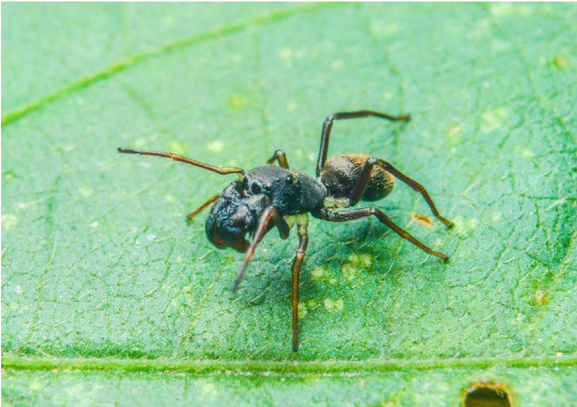
Sarinda marcosi

Todos las/os estudiantes que presenten su trabajo como primer autor/a en presentaciones orales o de poster, participarán automáticamente del concurso de presentaciones de estudiantes. Un panel integrado por reconocidos expertos/as de diversas nacionalidades evaluarán sus presentaciones. Por esta razón, durante las sesiones de posters, deberán permanecer cerca de sus posters para presentar el estudio y responder preguntas durante toda la sesión.