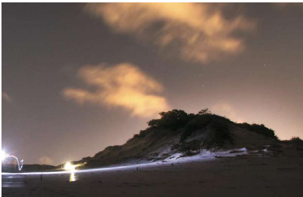
Muestreo de campo en Salvador de Bahía, Brasil

https://docs.google.com/forms/d/e/1FAIpQLScY68vjZ9Gx0jvI3rmT8FBN3drYS6ksHv7tdMDPcL9EPTGr_A/viewform